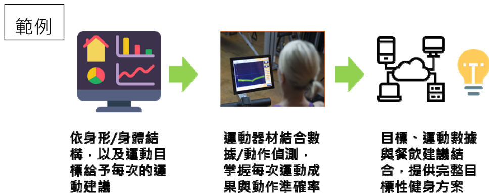
圖2、導入後應用服務模式 (TO-BE)