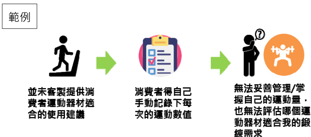
圖1、導入前現有服務情境 (AS-IS)